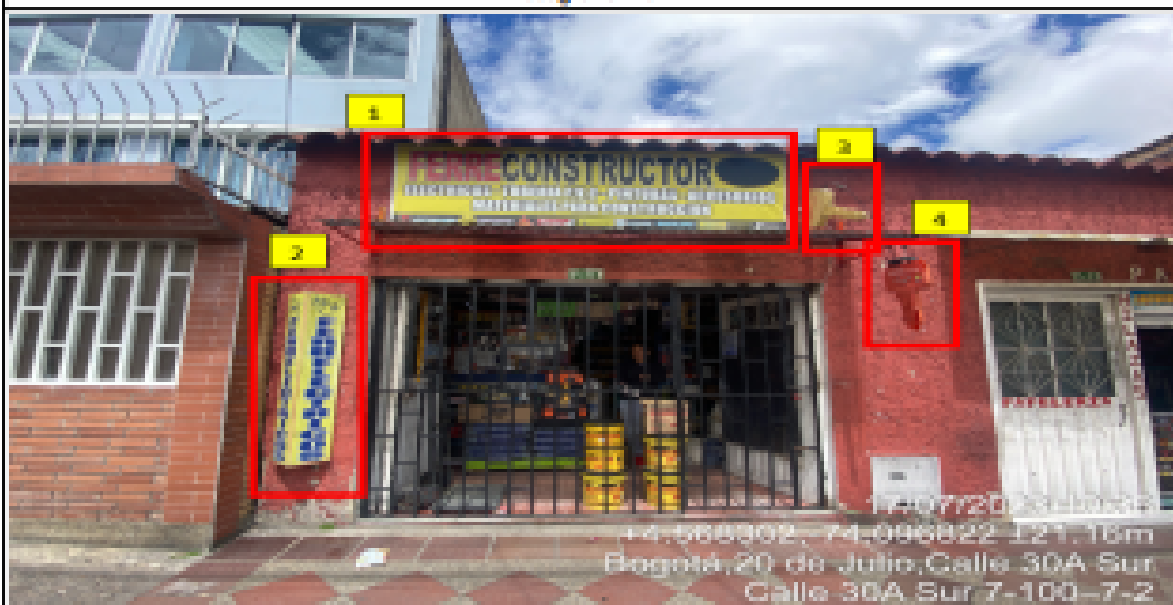
Fotografía No. 2

En la cual se evidencia la fachada del establecimiento comercial FERRECONSTRUCTOR en la que se observa un (1) elemento publicitario tipo aviso en fachada identificado con el número 1, el cual al momento de la visita técnica se encontraba instalado sin contar con el registro ante la SDA, así mismo tres (3) elementos publicitarios identificados con el número 2, 3 y 4 los cuales se encuentran volados de la fachada y son adicionales al único permitido.